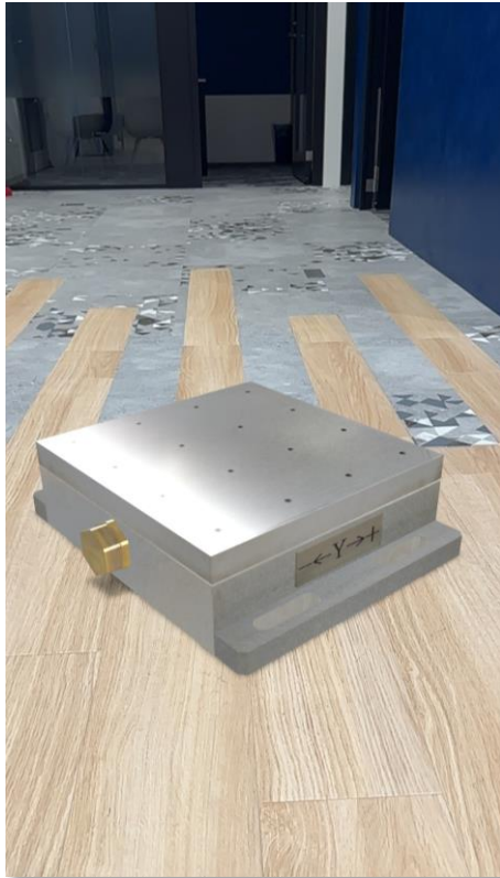
弊社事例：株式会社芝技研様