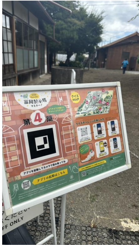
弊社事例：富岡製糸場様